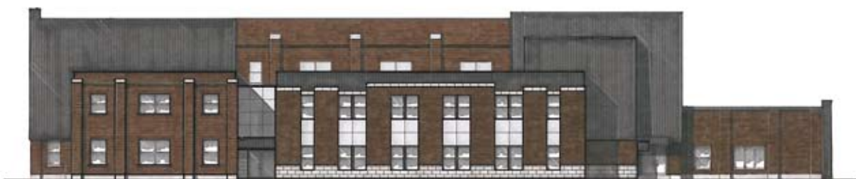
Le 2250 St-Olivier