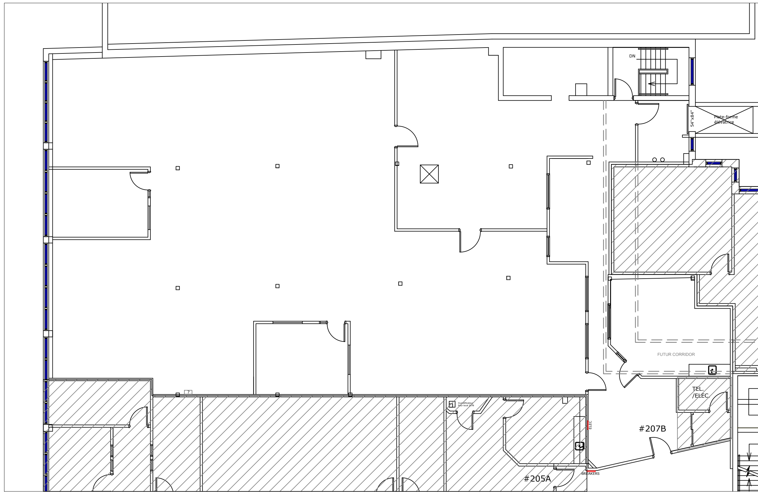
PLAN DU BUREAU